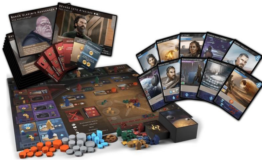
Desková hra Duna

Duny, ať už o herní Duně, románu od Franka Herberta či původním filmovém zpracování z roku 1984 od Davida Lynche. Takže pokud bude divák pouze zapálený fanoušek Duny, nikoli hráč, může se těšit na sérii zábavných mini-pořadů v doprovodu s nejrůznějšími soutěžemi, kterých se bude moci zúčastnit a vyhrát tak jedinečné filmové ceny.