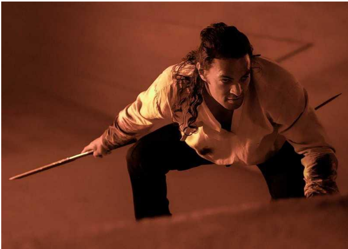
Filmové zpracování Duna 2021, Jason Momoa

Klasické mistrovské dílo od Franka Herberta s názvem Duna vypráví příběh, který se odehrává na pouštní planetě Arrakis a je příběhem chlapce Paula Atreida, dědice šlechtického rodu, který má za úkol vládnout nehostinnému světu, kde jedinou cennou věcí je melanž "koření", droga schopná prodloužit život a posílit vědomí, jenž se nachází pouze na planetě Arrakis. Melanž, po které touží celý známý vesmír, je cenou, pro kterou stojí za to zabít.