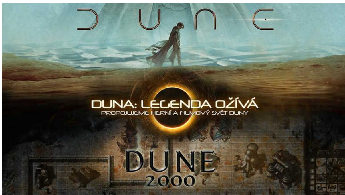
Hlavní vizuál projektu Duna: Legenda ožívá

Již příští týden od 28. 9. 2021 startuje projekt Duna: Legenda ožívá, který si dává za cíl propojit herní a filmový svět kultovního sci-fi Duna a to při příležitosti uvedení nového snímku na plátna kin, který má světovou premiéru v České republice 19. 10. 2021.