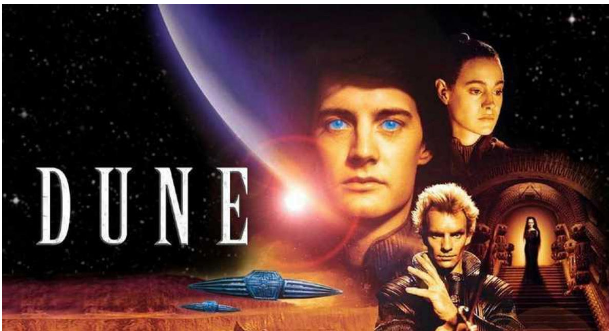
Původní filmové zpracování Duna 1984

Leto Atreides, bůh císaře Duny, zemře. Za patnáct set let, které uplynuly od jeho odchodu, se Říše propadla do zkázy. Velký Rozptyl způsobil, že miliony lidí opustily rozpadající se civilizaci a rozptýlily se za hranice známého vesmíru. Planeta Arrakis - nyní zvaná Rakis - se vrátila ke svému pouštnímu klimatu a její velcí píseční červi vymírají.