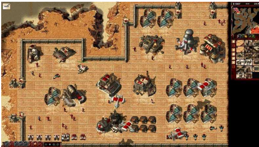
Real-time strategie Duna 2000

Turnaje poběží na vlastním serveru SupremeXP a open source enginu OpenRA, který umí na moderních počítačích a operačních systémech rozpohybovat klasické real-time strategie.